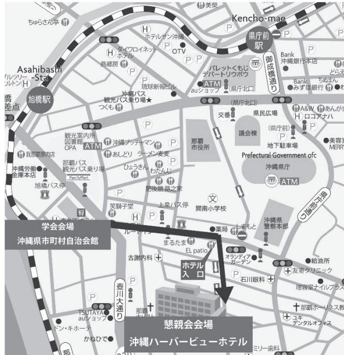
学会会場周辺エリアマップ